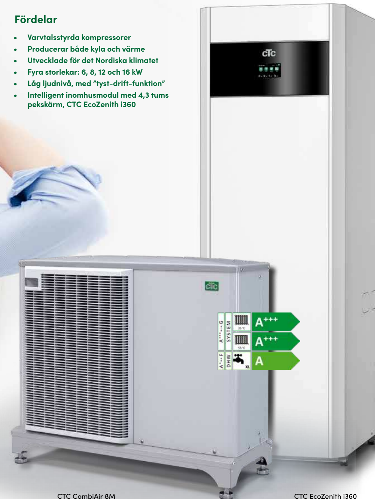
CTC CombiAir 8M