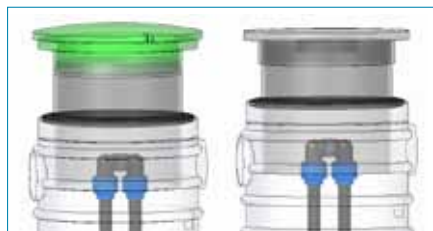
Teleskopiskt lock av polyeten (dubbelt låsbart) eller av gjutjärn.

Kompakt utförande: Ø 500 mm, höjd 2 - 2,4 m, sumpvolym 110-330 liter. Isolering finns som tillbehör.