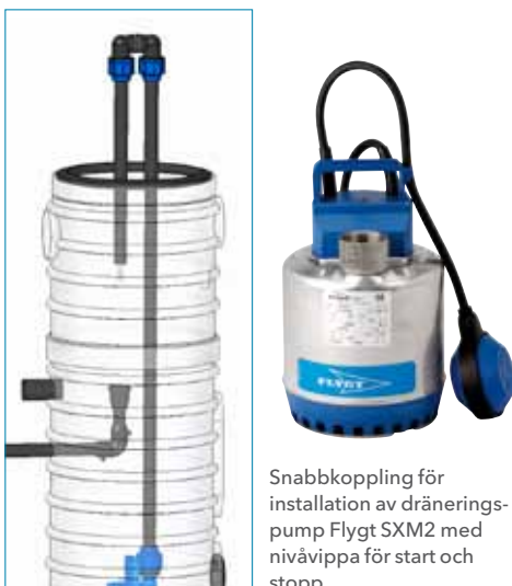
Snabbkoppling för installation av dräneringspump Flygt SXM2 med nivåvippa för start och stopp.